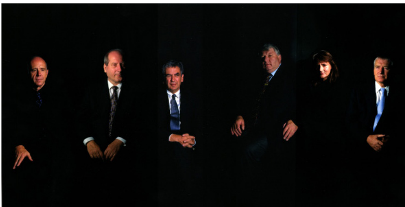
Six Bundesminister, 2000 Courtesy Clegg & Guttman