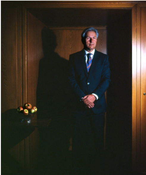
Allegory of Government (Klaus Wowereit), 2011 Courtesy Clegg & Guttman et Galerie KOW, Berlin