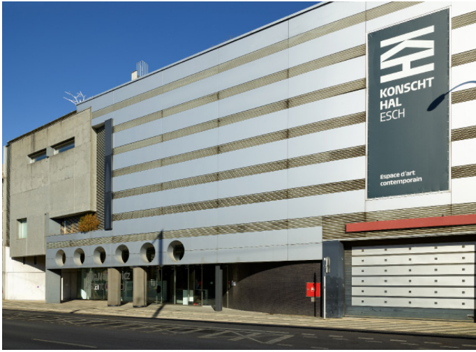
Konschthel Esch