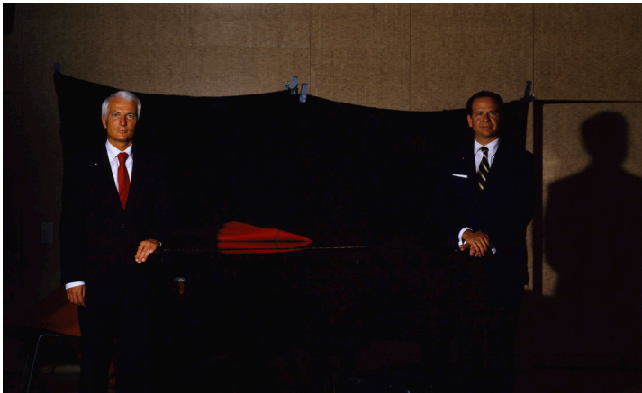
Two Executives 2006