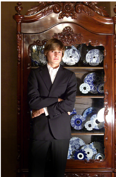
Portrait of a Young Man, 2006