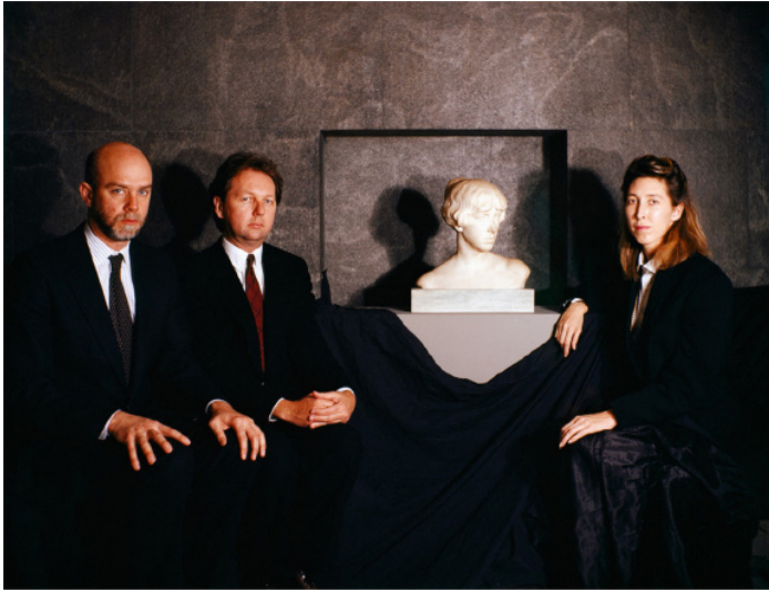
Curators of the Whitney Biennial, 1987 Courtesy Clegg & Guttmann et Galerie Nagel Draxler, Berlin/Cologne/Munich